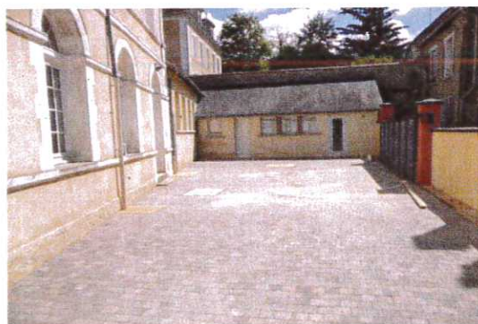
Cour de l'école maternelle