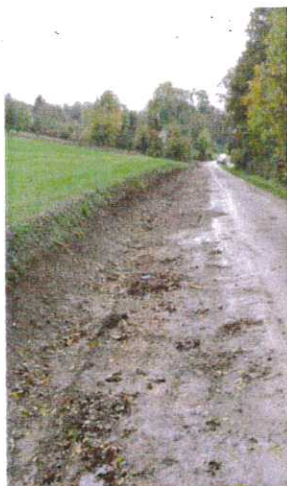
Curage fossé route de Sormery

Formation d'un agent pour conduite d'engins et Super Poids Lourds.