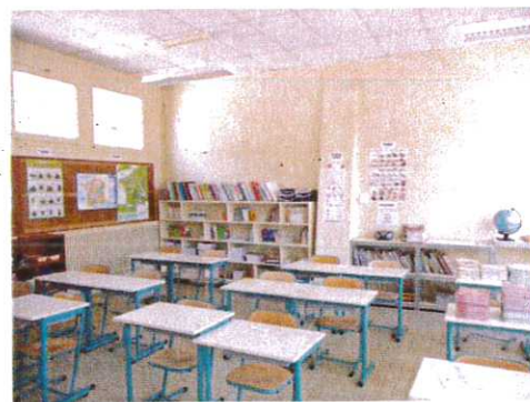
Classe des CE1/CE2