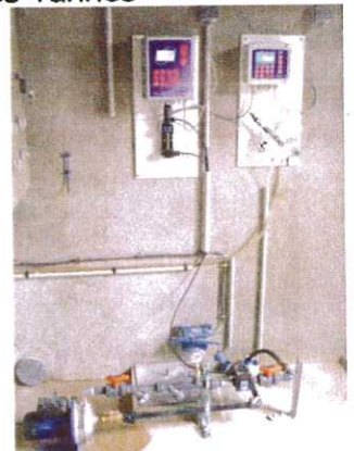
Chloration : matériels installés