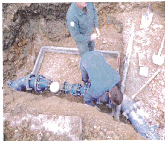
Chloration : installation des vannes