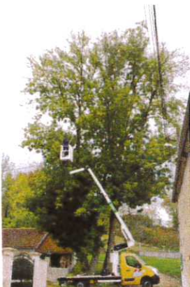
Nid de frelons Asiatique