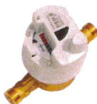
Compteur d'eau avec cible