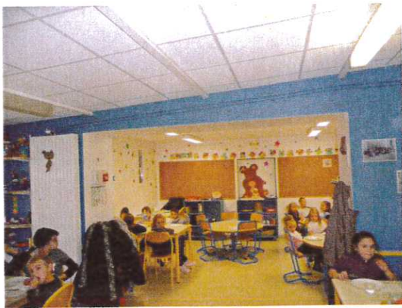
Insonorisation salles de cantine