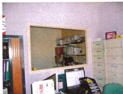
Agencement des bureaux mairie