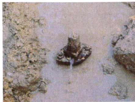
Fuites d'eau et réparations