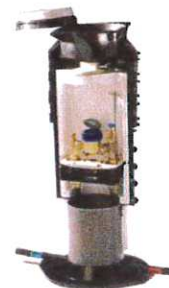
Regard pour compteur d'eau