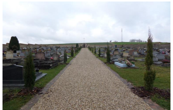
Entretien des cimetières