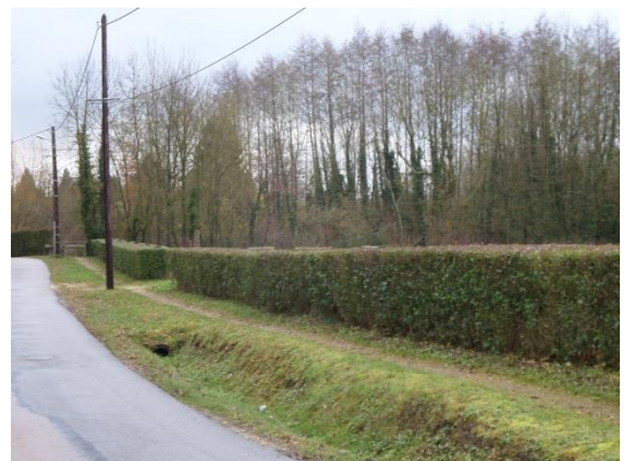
Entretien des espaces verts

AD'AP : Agenda d'accessibilité programmée