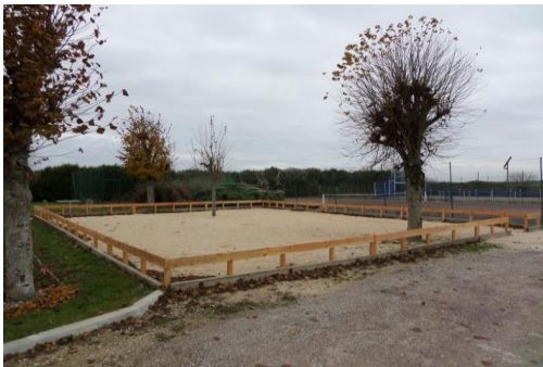
AD'AP : Entourage du Boulodrome

Travaux importants effectués par nos agents communaux :